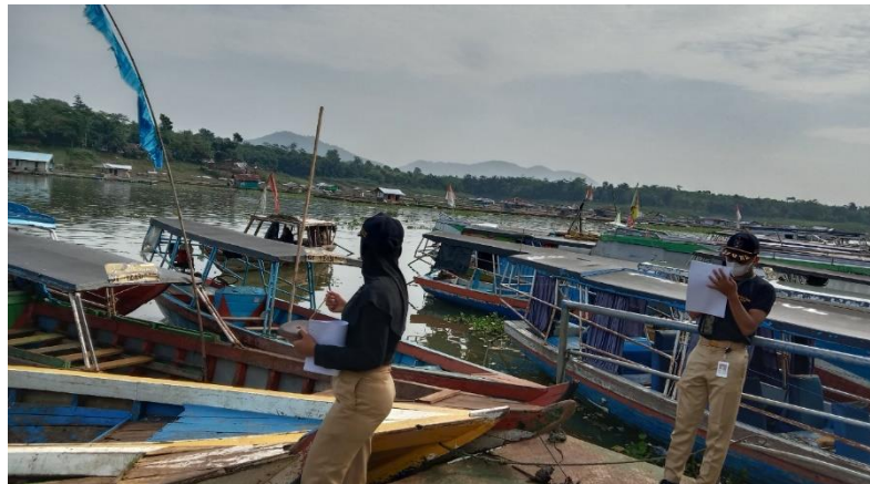
Gambar 3.2 Observasi data di Dermaga Jangari

Observasi yaitu, mendapatkan data dengan cara pengamatan langsung di lokasi. Dengan demikian dapat dilihat secara langsung kondisi kelengkapan alat keselamatan kapal yang beroperasi di Dermaga Jangari