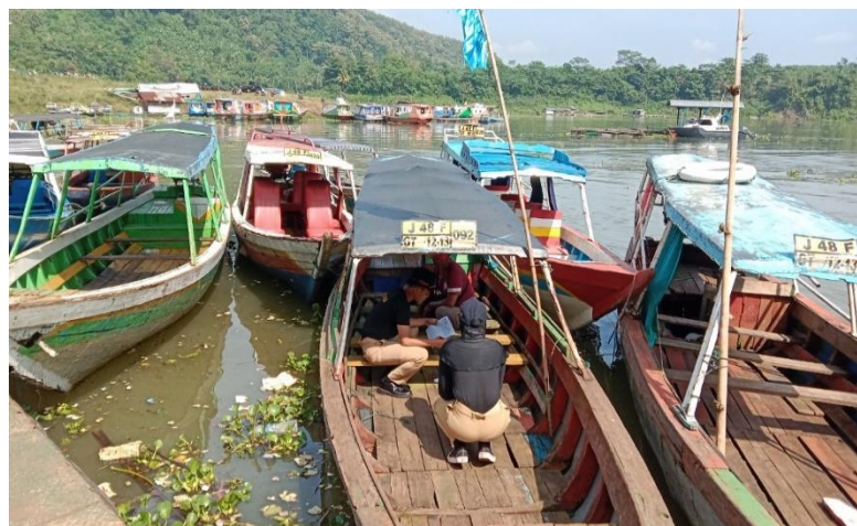
Gambar 3.3 Wawancara kepada operator kapal di Dermaga Jangari