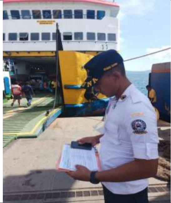
Survei waktu bongkar muat