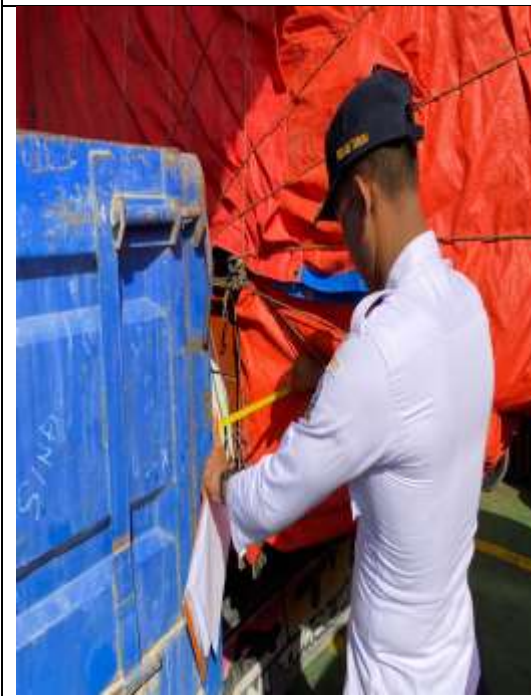
Survei jarak antar kendaraan