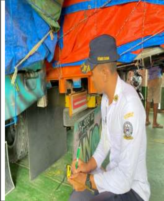
Survei jumlah tali pengikat