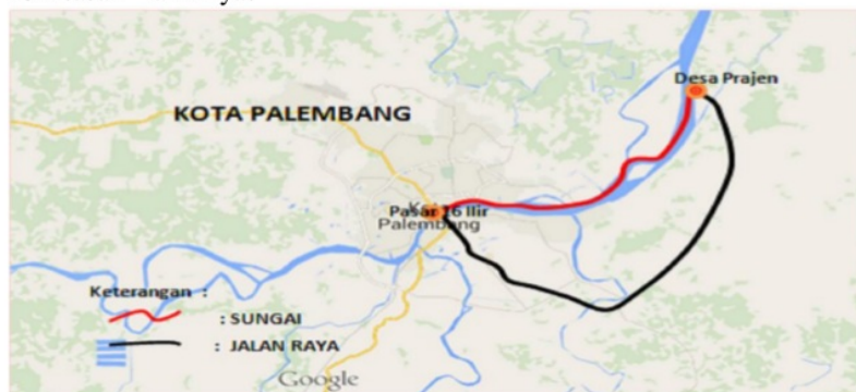
Gambar 1: Lintasan trayek angkutan Jalan dan Sungai

Untuk trayek dari prajen ke 16 ilir , dimana kondisi angkutan ini merupakan trayek transit atau terdiri atas 2 (dua) lintasan trayek yaitu Prajen-Plaju dan Plaju 16 Ilir yang secara nyata menambah waktu perjalanan ketika akan berpindah angkutan dari satu trayek kelintasan lainnya.