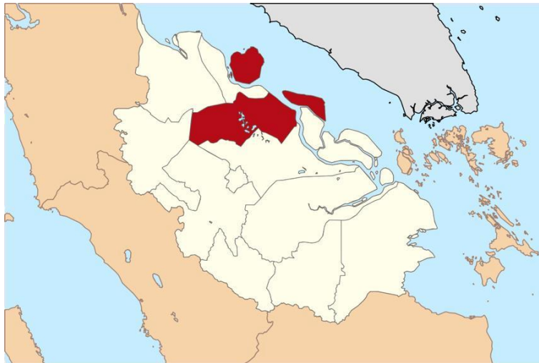
Gambar 1.1 Peta Wilayah Kabupaten Bengkalis

Kabupaten Bengkalis adalah salah satu kabupaten di Provinsi Riau, Indonesia. Wilayahnya mencakup daratan bagian Timur Pulau Sumatra dan wilayah kepulauan, dengan luas adalah 6.973,00 km 2 . Jumlah penduduk Bengkalis pada tahun 2020 sebanyak 593.397 jiwa, dan ibu kota kabupaten berada di kecamatan Bengkalis tepatnya berada di Pulau Bengkalis yang terpisah dari Pulau Sumatra. Pulau Bengkalis sendiri berada tepat di muara Sungai Siak, sehingga dikatakan bahwa Pulau Bengkalis adalah delta sungai Siak. Kota terbesar di kabupaten ini adalah kota Duri, yang berada di kecamatan Mandau.